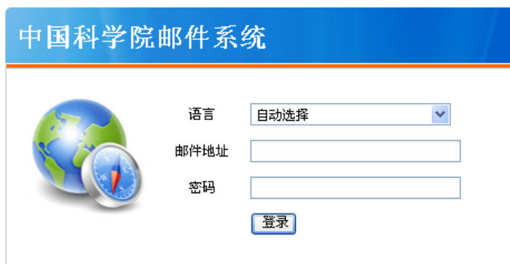
图 1 反垃圾邮件系统登录页面

(2) 在图 1 中，输入完整的邮件地址，邮箱密码后，点击“登录”按钮进入反垃圾邮件系统。